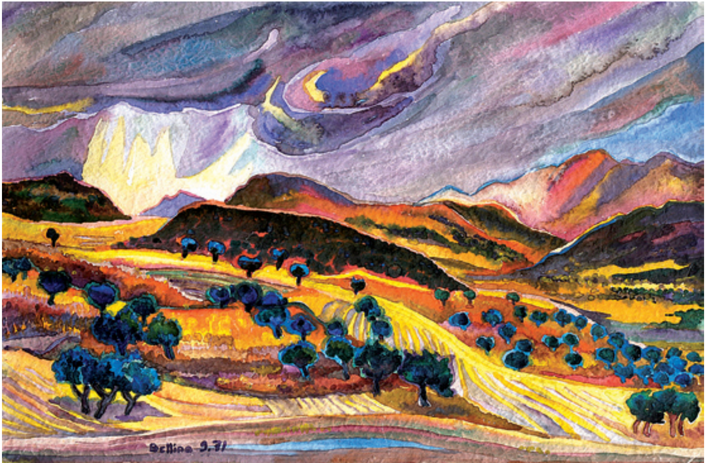
Bettina Heinen-Ayech; Sommergewitter in Algerien; Aquarell auf Papier, 36 cm x 48 cm, 1974 © Bettina Heinen-Ayech

Ausstellung bis zum 21. September 2017 in der Villa Stahmer, Georgsmarienhütte