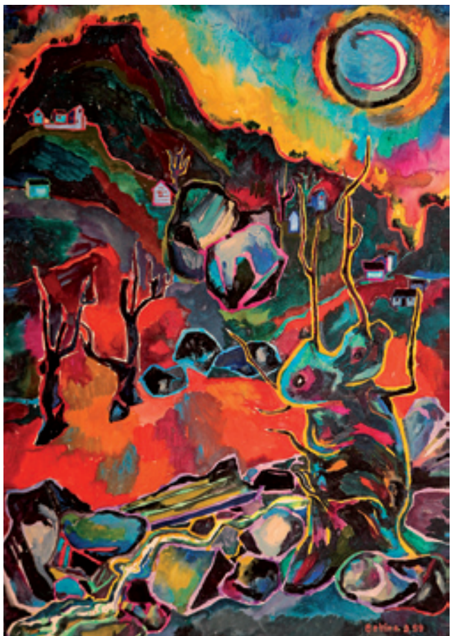
Bettina Heinen-Ayech; Waldbrand im Tessin, Schweiz; 1953, Aquarell auf Papier, 102 cm x 73 cm © Bettina Heinen-Ayech

über hundert Einzel- und zahlreichen Gruppenausstellungen in Europa, Amerika und in Afrika gezeigt. Zahlreiche Kataloge und Filmdokumente erzählen ihre Geschichte, die Künstlerin und ihr Werk fanden Eingang in Dichtung und Literatur.